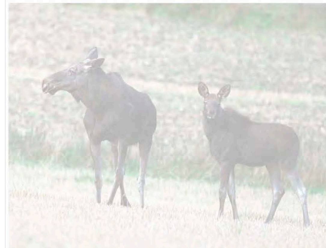
FRYKTER ELGJAKTEN: Jakten pågår i områder relativt nær Åttekanten skole, og i fjor var det en alvorlig jaktulykke i området.