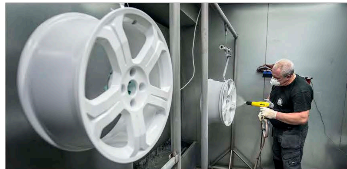
LAKKEN BAKES INN: Pulverlakkering ved 200 grader er det eneste som duger for at lakken skal hefte på felgen over tid.

I dag reparerer de i underkant av 10.000 felger i året og det er det ingen andre i Skandinavia som kan levere maken til. Eventyret begynte for tre år